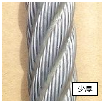
ストランドの谷間が少し埋まる程度