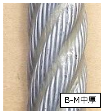
ストランドの谷間が半分埋まる程度