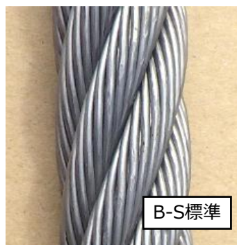
ストランド製造時のみ塗油